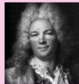
J. B. de Boismortier