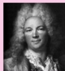
J. B. de Boismortier